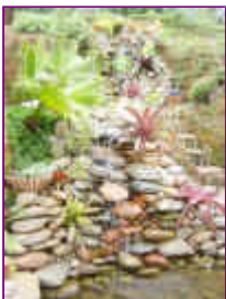
Ref: Fácil-2- 21

20- Para cada caso projetamos um equipamento pré-montado, dependendo das medidas e condições de uso. Este equipamento já será fornecido montado e basta submergir na água.