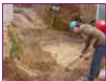
Ref: Fácil-2- 02

01 - Cave um buraco em forma de concha, mantenha o fundo com aproximadamente 50cm de profundidade. Retire torrões e pedras, deixe o fundo liso, não precisa socar ou firmar a terra, basta cavar.