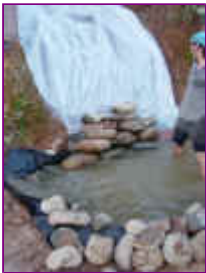
Ref: Fácil-2- 19

19- Após ter feito a cava deite o plástico cobrindo toda a área onde você colocará as pedras. Recorte sobras excessivas e monte assim a sua cachoeira. Observe que as pedras mais achatadas servirão melhor para estrutura da cascata.