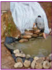
Ref: Fácil-2- 18