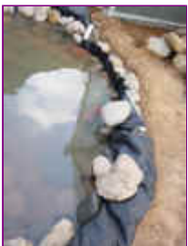
Ref: Fácil-2- 11

10- As pedras de dentro farão o apoio para as pedras da borda. Apenas apoié as pedras buscando uma forma de apoiá-las umas sobre as outras.